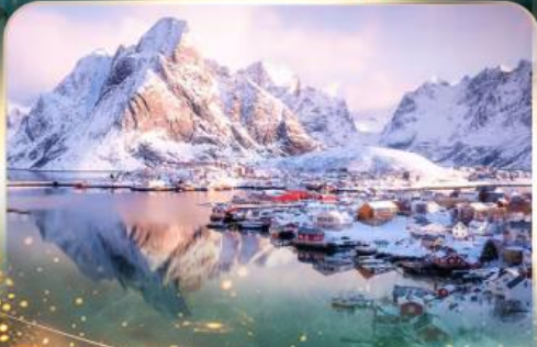
หมู่บ้านเรเนน