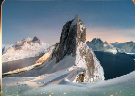
เกาะเซนต์ปีเตอส์