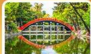
ศาลเจ้าสุมิโยชิ โกเบ