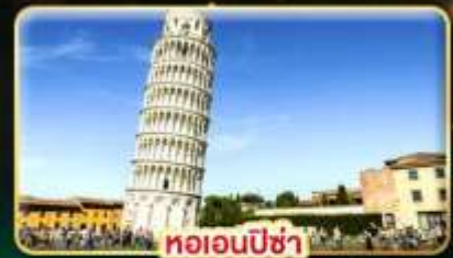
หออนพีซ่า