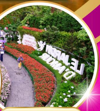
Le Jardin d'Amour