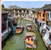
หมู่บ้านโบราณซูเจียเจี๋ย