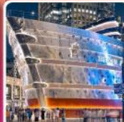
เรือหลุยส์