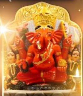
องค์สิทธีวินายก