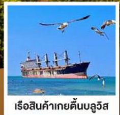
เรือสินค้าเกย์ตันบลูวิส