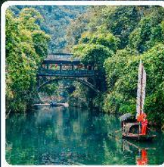
หมู่บ้านชาบเสี่ยเหมินเจีย