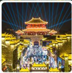
เมืองโบราณเซียงหยาง