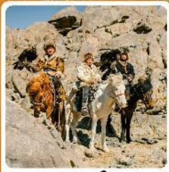
ชาวมองโกล