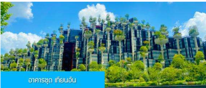
อาคารชุด เทียนอัน

เที่ยง รับประทานอาหารกลางวัน ณ ภัตตาคาร (6)