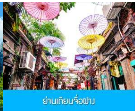
ย่านเกียบจื่อฝาง