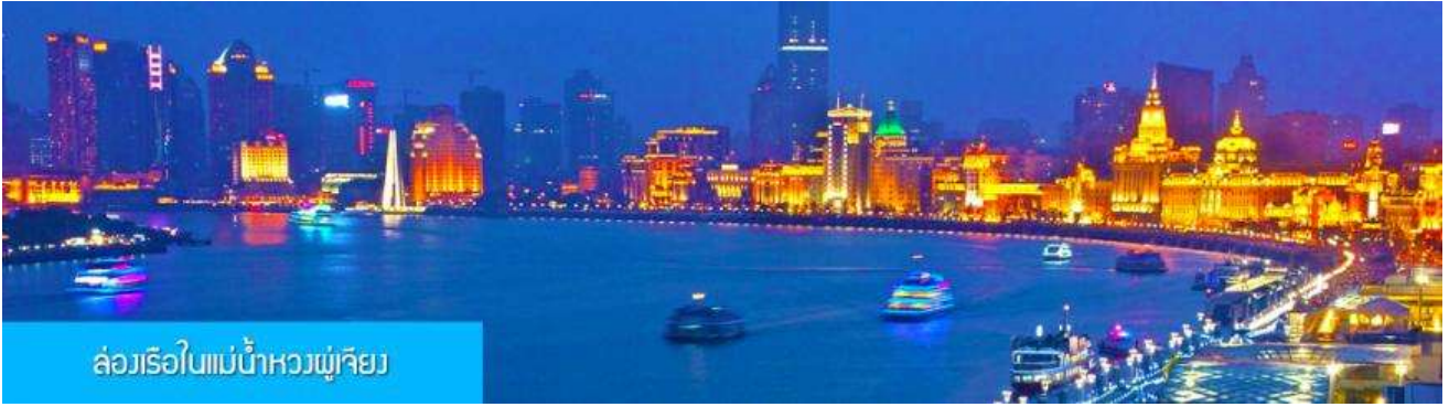
ล่องเรือในแม่น้ำหวงผู่เจียง