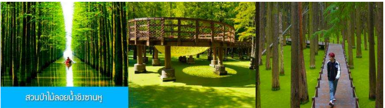
สวนป่าไม้ลอยน้ำชิงชานหู

พักที่ โรงแรม Holiday Inn Express Hotel 4* หรือเทียบเท่าในนครเซี่ยงไฮ้