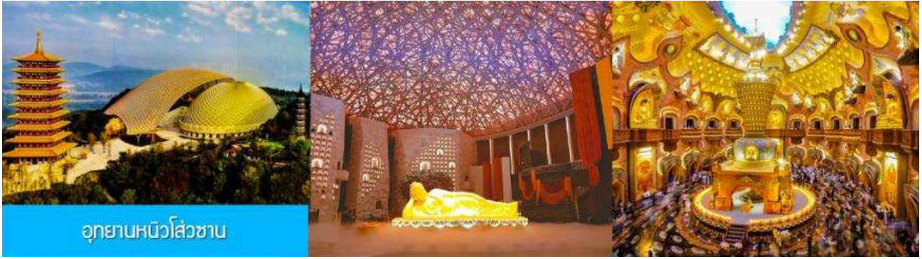
อุทยานหนิวโล่วซาน