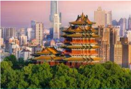
นครนานกิง