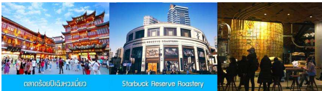
ตลาดร้อยปีฉงหวงเบี่ยน

พักที่ โรงแรม Holiday Inn Express Hotel 4* หรือเทียบเท่าในนครเซี่ยงไฮ้