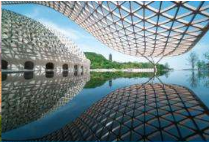
อุทยานกุ่มกึ่งยวหนิวโล่วซาน