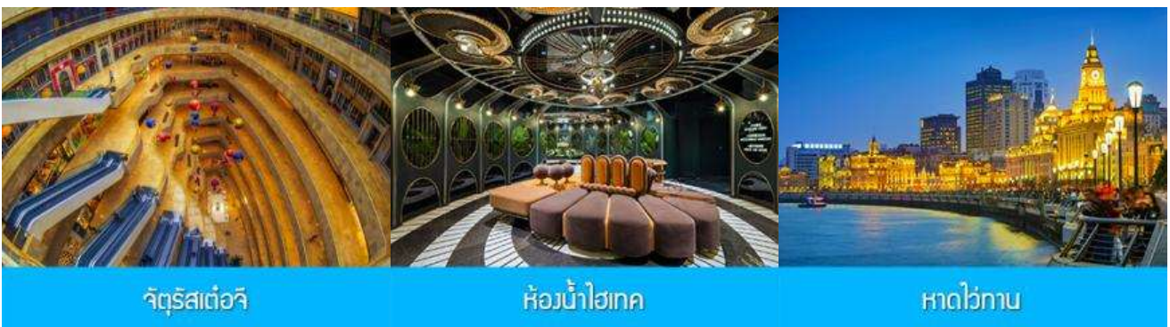
จัตุรัสเต๋อจี

พักที่ โรงแรม Holiday Inn Express Dongshan Hotel 4* หรือเทียบเท่าในนครหนานจิง