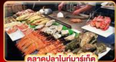
ตลาดปลาไถ่บ๋ารเก็ด