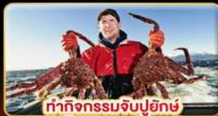
ทำกิจกรรมจับปูยักษ์ "พร้อมเมนูสุดพิเศษ"