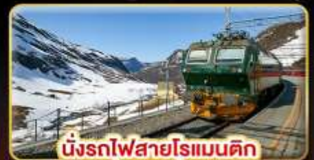
นั่งรถไฟสายโรแมนติก "พร้อมสปา"