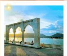
Ana Sagar Lake