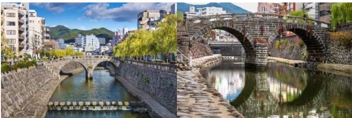
สะพานเมกาเนบาชิ (Meganebashi Bridge)

นากาซากิ (Nagasaki) เป็นเมืองที่ตั้งอยู่ทางตะวันตกของเกาะคิวชู ประเทศญี่ปุ่น เมืองนี้เป็นที่รู้จักจากประวัติศาสตร์อันยาวนานและวัฒนธรรมที่หลากหลาย เมืองนี้เป็นที่รู้จักจากชายหาดที่สวยงาม อาหารทะเลสด และสถานที่ท่องเที่ยวทางประวัติศาสตร์และวัฒนธรรมมากมาย