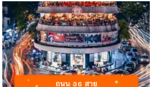
ถนน 36 สาย