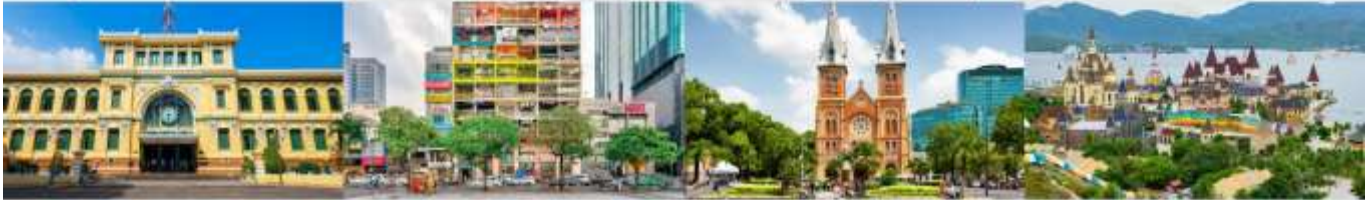
ไบรณีย์กลางโฮจิมินห์