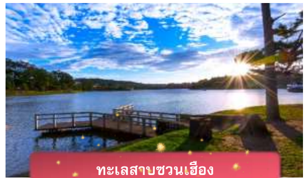
ทะเลสาบชวนเอียง

ที่พัก The Western Hill ระดับ 4 ดาวหรือเทียบเท่า