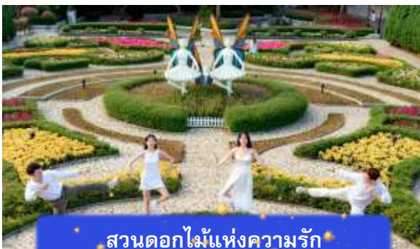
สวนดอกไม้แห่งความรัก

อิสระท่านท่องเที่ยว สวนสนุกแพนตาซีพาร์ค ซึ่งมีเครื่องเล่นหลากหลายรูปแบบ เช่น ทำทายความมันส์ของหนัง 4D ระทึกขวัญกับบ้านผีสิง เกมสันทุกๆ เครื่องเล่นเบาๆ รถบั้ง หรือจะเลือกซื้อป๊อปปิ้งของที่ระลึกของสวนสนุก และ จัตุรัสแห่งดวงดาว เปรียบเสมือนการเดินทางสู่อาณาจักรแห่งดวงดาวที่มีเส้นทางเชื่อมต่อระหว่างอาณาจักรแห่งดวงจันทร์และอาณาจักรแห่งดวงอาทิตย์ถนนที่แสนงดงาม และสถาปัตยกรรมที่ล้ำสมัยจุดเด่นของที่แห่งนี้ก็คือกระจกใสทรงสามเหลี่ยมที่ดูคล้ายกับพิพิธภัณฑสถานลูฟวร์ที่ฝรั่งเศส ให้ความรู้สึกละลานตาเหมือนท่านกำลังท่องอยู่ในโลกแห่งเวทมนต์และดวงดาว (ไม่รวมค่าเข้าชมหุ่นขี้ผึ้งราคาประมาณ 1 แส่นดอง)