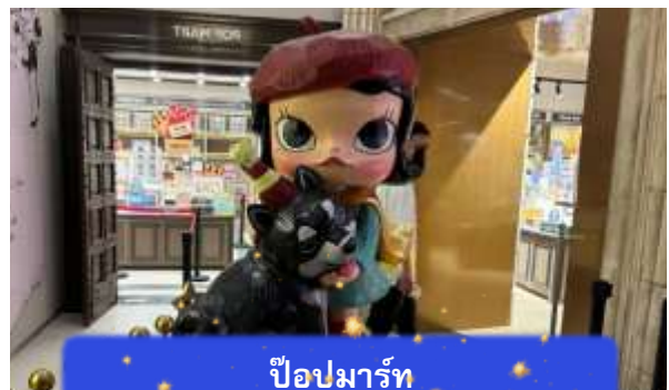
ป๊อปมาร์ท