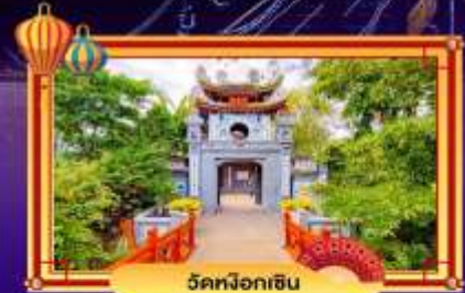
ฝันทึอหึน