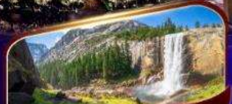
อุทยานแห่งชาติโยเซมิตี