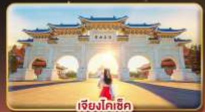
เจียงโคเช็ก