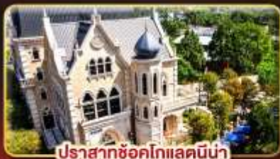
ปราสาทช็อคโกแลตมิน่า

มรดกแห่งเมืองสีกันแห่งไทเป ซ้อปั้งจู่ใจ..ตลาดซีเหมินติง ตลาดโตง