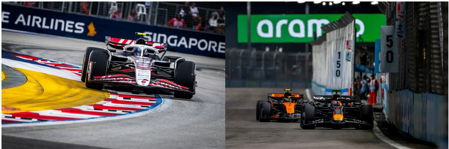
ชม รอบ SPRINT RACE + QUALIFYING

**เดินทางด้วยตนเอง เข้าร่วมงาน FORMULA 1 SINGAPORE GRAND PRIX 2026**