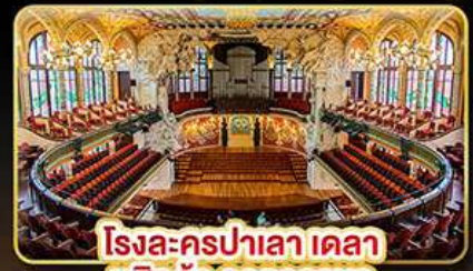
โรงละครปาลาเลา เดลา มุสิก้า คาคาลานา