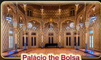
Palácio the Bolsa

สัมผัสดินแดนแห่งอารยธรรมมัวร์ “ชมเมืองมรดกโลก” สถาปัตยกรรมหลากหลายรูปแบบ