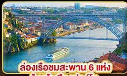
ล่องเรือชมสะพาน 6 แห่ง ในคูโรเมืองปอร์โต