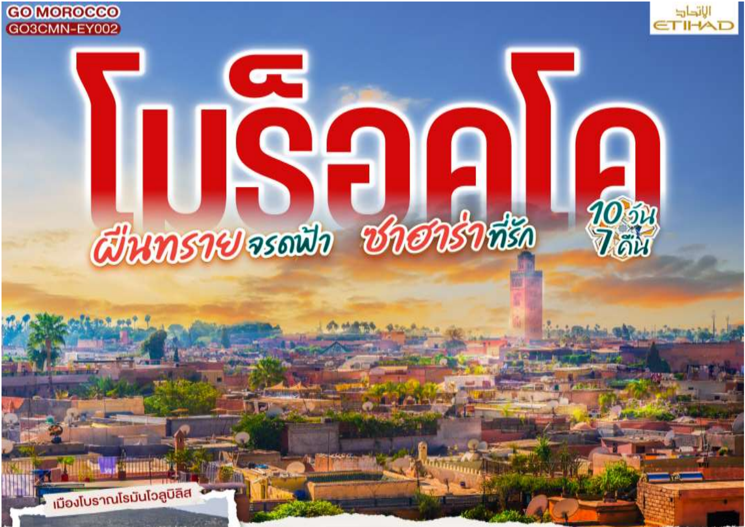
เมืองโบราณโรมันโวลูบิลิส