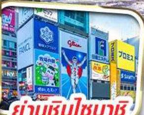
ย่านชินโซบะชิ