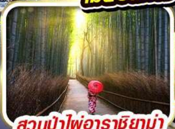
สวนป่าไฟอาราชิยาม่า