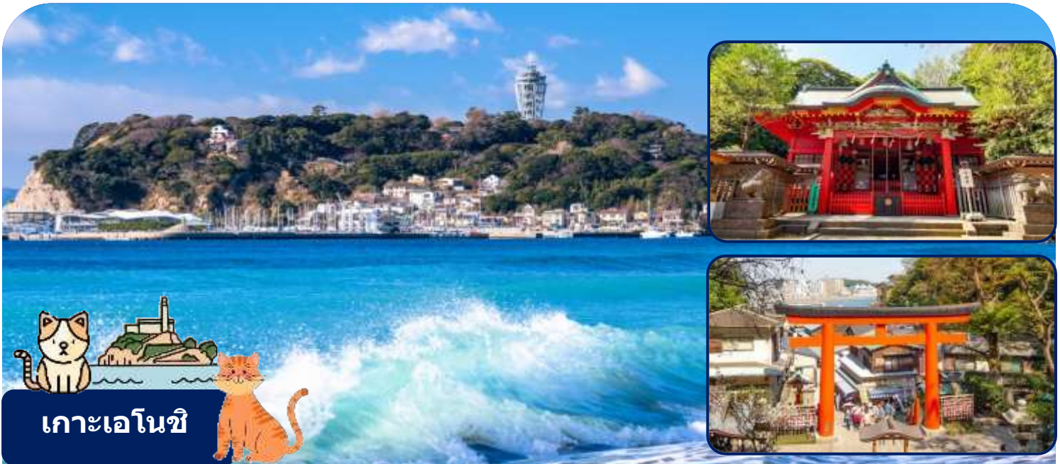
เกาะเอโนชิ

นำท่านเดินทางสู่เมืองคามาคุระ จังหวัดคางาวะ เมืองประวัติศาสตร์ที่ขึ้นชื่อเรื่องวัดวาอาราม และวิวทะเลสุดโรแมนติก ให้ท่านได้สัมผัสกลิ่นอายญี่ปุ่นแบบดั้งเดิมผสมผสานกับความสงบของธรรมชาติ