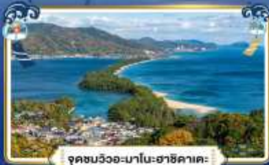
จุดชมวิวกะมาโมะฮาชิคาตะ