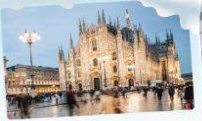
คูโอโม มิลาน