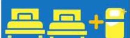
เตียง 3 กาน ที่นอนเสริม TRIPLE