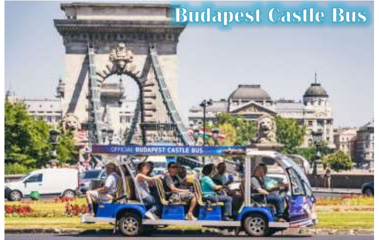
Budapest Castle Bus

บูดา Castle Hill *เนื่องจากตัวปราสาทตั้งอยู่บนเนินเขา การเดินทางโดยรถไฟไฟฟ้า จะเพิ่มความสะดวกสบายให้กับท่าน โดยรถไฟไฟฟ้าจะจอดรับและส่งตามจุดต่างๆ ในย่านเมืองเก่า ไม่ต้องเดินเท้าเป็นระยะทางไกล* จากนั้นนำท่านเดินชมความงดงามของเมืองเก่ารอบๆปราสาทบูดา ที่เริ่มมีการก่อสร้างมาตั้งแต่ปี ค.ศ.1265 และต่อเติมปรับปรุงมาโดยตลอด จนกระทั่งปัจจุบัน โดยตัวอาคารในปัจจุบันเราจะเห็นเป็นสไตล์บาโรค ที่ดู