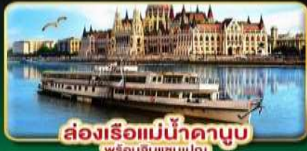
ล่องเรือแม่น้ำดานูบ พร้อมจิบแชมเปญ