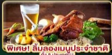
พิเศษ! ลิ้มลองเมนูประจำชาติ ถึง 5 ประเทศ!!