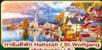
การันตีพิก Hallstatt / St. Wolfgang หรือริชทะเลสาบ 1 คืน