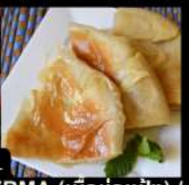
เมนูสุดพิเศษ !! KOSHARI (ข้าวคั่วกั่ว) / SHAWERMA (เนื้อห่อแป้ง) / FITEER BALADI (พิซซ่าอียิปต์)