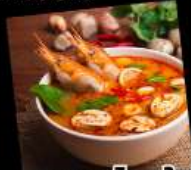
อาหารไทยในไคโร