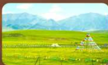
ทุ่งหญ้าออร์คอส