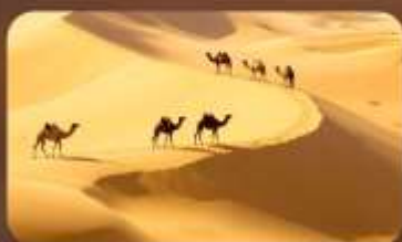
เนินทรายเสียงชวาวาน