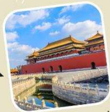
3 พระราชวังต้องห้าม