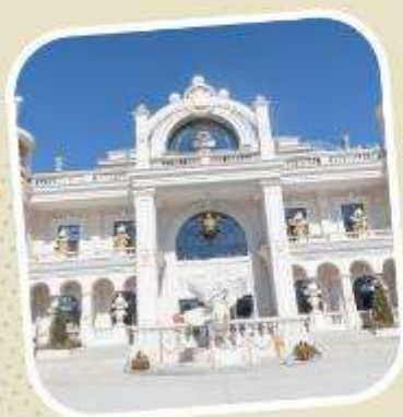
6 POP LAND