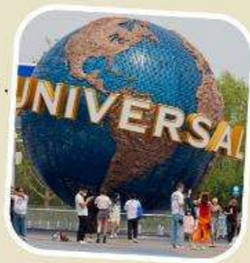
5 UNIVERSAL BEIJING