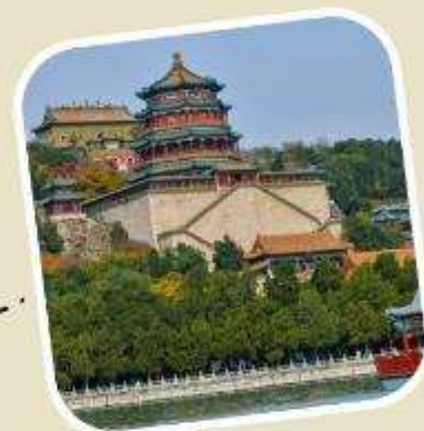
4 พระราชวังฤดูร้อน