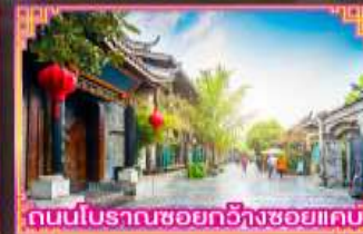
ถนนโบราณซอยกว้างซอยแคบ