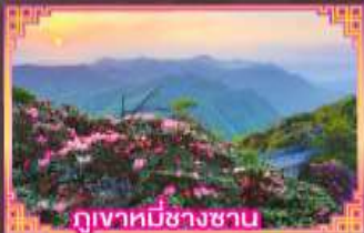
ภูเขาหมื่นซางซาน