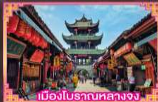
เมืองโบราณหลางจง