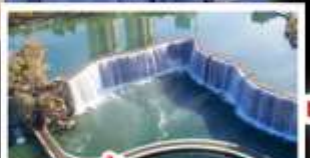
สวนน้ำตกคุณเหมิง