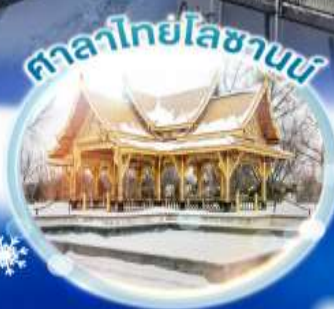
ศาลาไทยโบราณ