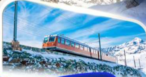
ขบวนรถไฟฟันเฟืองทอนฮอร์นเกรต