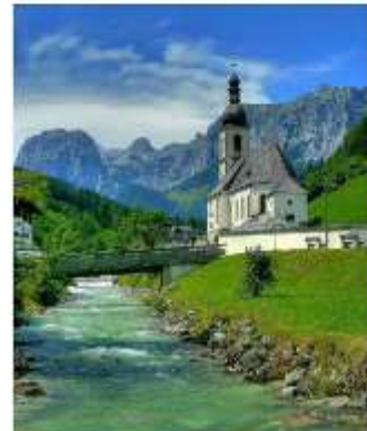
ออสเตรียบาวาเรียดินแดนแห่งเทพนิยาย

ออสเตรีย – บาวาเรีย (Austria-Bavaria) ดินแดนวัฒนธรรมเก่าแก่ที่ครอบคลุมสองประเทศและแทบแยกกันไม่ออกเลยว่าเราเที่ยวอยู่ในออสเตรียหรือเยอรมัน ท่านจะประทับใจไปกับหมู่บ้านเล็กๆน่ารัก ที่ตั้งอยู่บริเวณริมทะเลสาบในเทือกเขา “เยอรมัน-ออสเตรียแอลป์” พร้อมบริการอาหารรสเลิศและที่พักอย่างดีระดับ 4 ดาว หลูหร่าที่เราคัดสรรมาให้ท่านได้พักผ่อนอย่างเต็มที่ให้การเดินทางของท่านคุ้มค่าที่สุดที่สุดในเส้นทางที่สวยงามที่สุดของออสเตรีย-บาวาเรีย