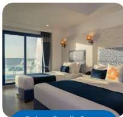
Deluxe Family Room Seaview with Balcony