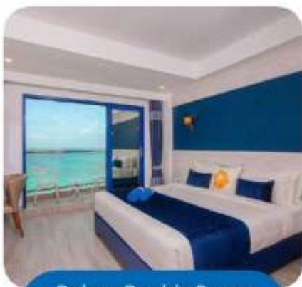
Deluxe Double Room Seaview with Balcony